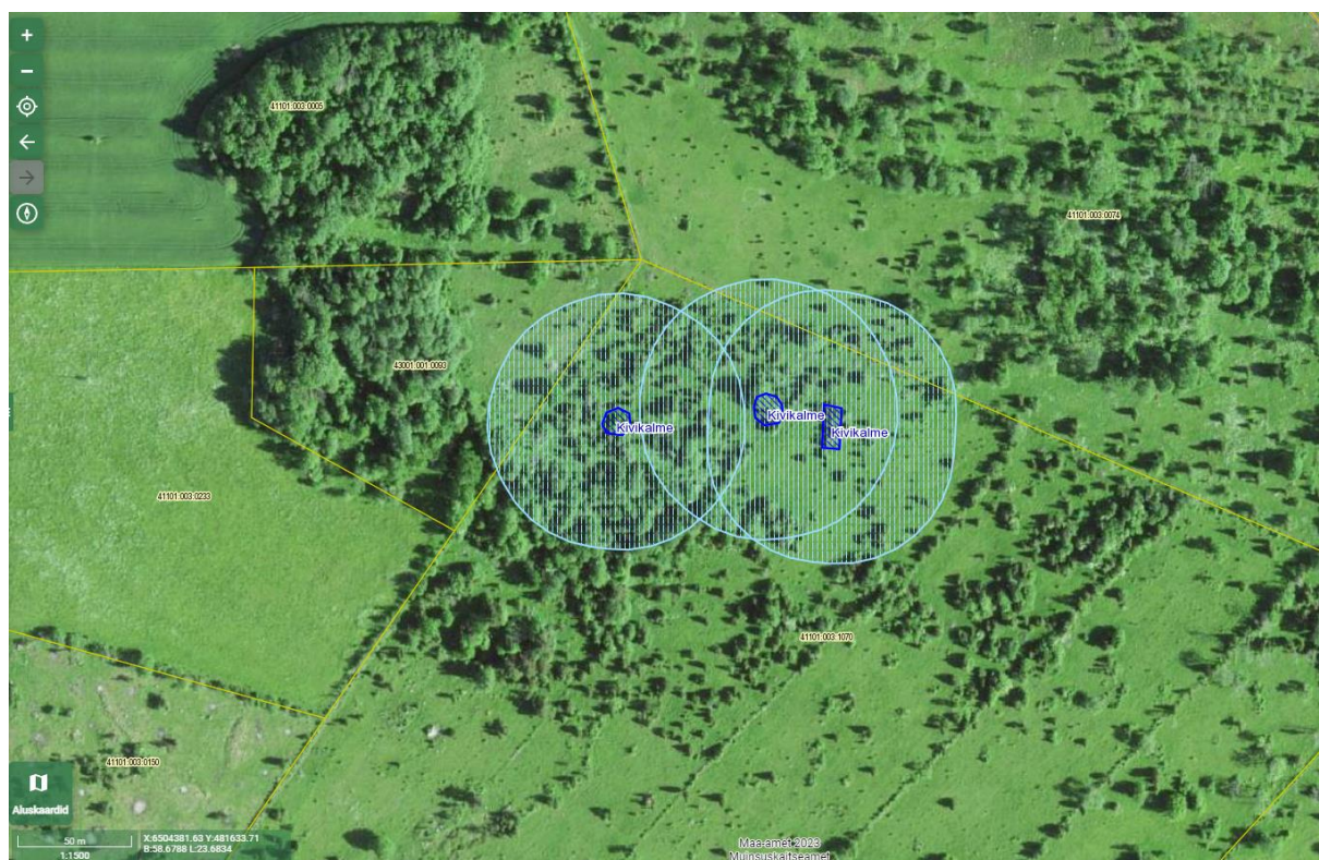
Lisa 2. Kivikalmete reg-nr 9991, 9992, 9993 asukohad Maa-ameti kultuurimälestiste kaardikihil seisuga 09.06.2023. (Alus: Maa-ameti kultuurimälestiste kaardikiht)